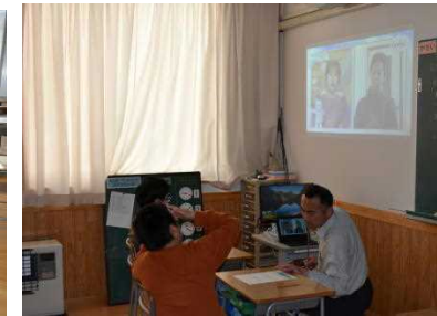
3組 「Thanks! (感謝)」