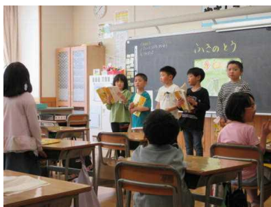
2年生 「きらきらいっぱい やさしさいっぱい」