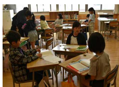
3年生 「キラッといっぱい十二人」