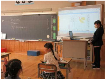
パスワードを練習する1年生

折に触れて、秋田県教育委員会義務教育課の指導主事が来校し、鳥海小学校の取組、子どもたちの様子、教師の関わり方などについて、伴走者のような助言をしてくれています。5月16日、二人の指導主事が来校して助言してくださいました。子どもたちが相手の話を受け入れるような聞き方になっていること、端末を進んで使っていること、子どもの間違っただけを取り上げてそれをみんなで解決している授業が見られたことなどが話題になりました。鳥海小学校では、子どもも教職員も一人一人学びを深めようとしています。