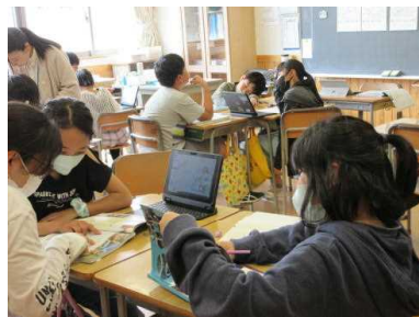
端末資料と図書資料を比べ合う5年生