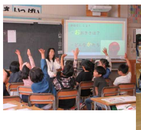
クイズの後に本や端末で調べる2年生