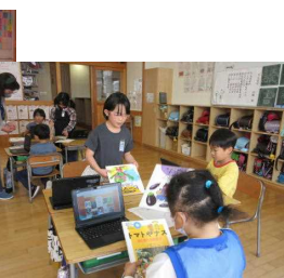
GoogleEarthで鳥海小学校周りを調べる3年生