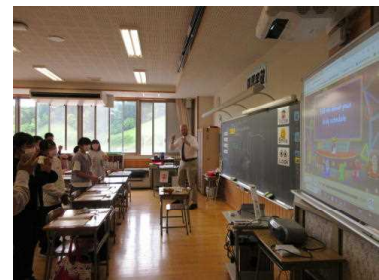
デジタル教科書でチャンツする6年生