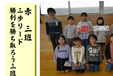
赤 三 班 三歩リード 勝利を勝ち取るう 3 班