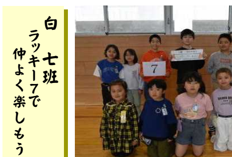
白 七 班 ラッキーフで 仲よく楽しもう