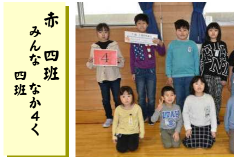
赤 四 班 みんななか 4 班