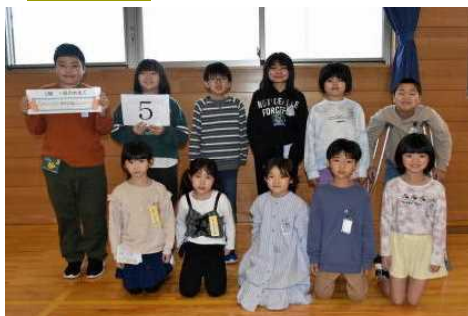
白 五 班 なかよく元気に 勝利を目指してレッツゴー