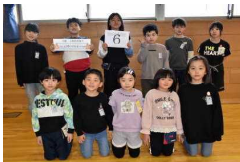
白 六 班 みんなで仲良く 元気に楽しもう 6 班