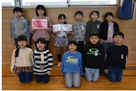
赤 二 班 力を合わせて ここにこ 2 班