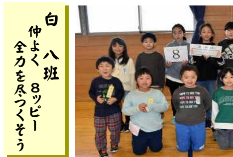
白 八 班 仲よく 全力を尽つくそう

22日(月)下校指導 ～自分の命を自分で守る～ 本校では下校時に、バスの号車ごとに集合、整列します。現在、繰り返し声掛けしているのは「徒歩区間の一列歩き」「シートベルト着用」と「乗車中は着席」のルールです。22日は、下校指導と地域確認を行い、安全確認を行います。 下校時刻13:35です。