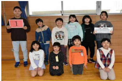
赤 一 班 仲の良さが 一位の 1 班

4月12日(金)は今年度の鳥海キッズ8班が顔合わせをしました。6年生が提案するグループのめあてを確認し、メンバーの自己紹介をして、今年の活動に期待を膨らませました。