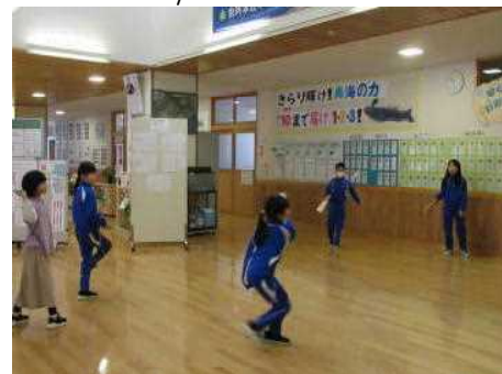
12/19 長休みの羽根つき遊び

子どもたちが安心、安全に冬休みを迎えられるのは、保護者の皆様、地域の皆様のご支援とご協力のおかげと心から感謝申し上げます。明日、12月26日(火)から1月14日(日)までは子どもたちが楽しみにしている冬休みです。年末年始は不規則な生活になりがちですが、生活リズムを整え、安全・健康で楽しい冬休みになるよう、子どもたちの見守りを引き続きよろしくお願いたします。