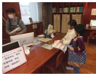
10日：2年生中央図書館で本を借りる