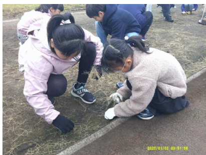
8日：ありが10デー小中合同奉仕作業