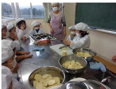
7日：1年生さつまいもパーティー