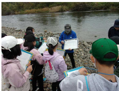
10日：5年生ジオ学習で川のつくりを学ぶ