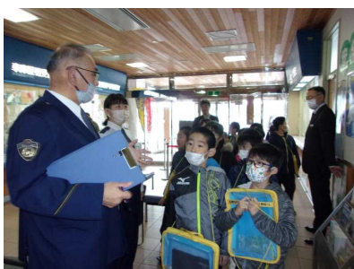
14日：3年生 警察署・消防署見学