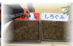
キバナコスモスの種も いっぱいです