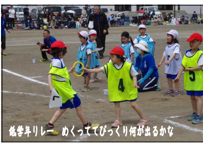
低学年リレー めくってびっくり何が出るかな