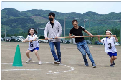
中学年親子で鳥海ハリケーン