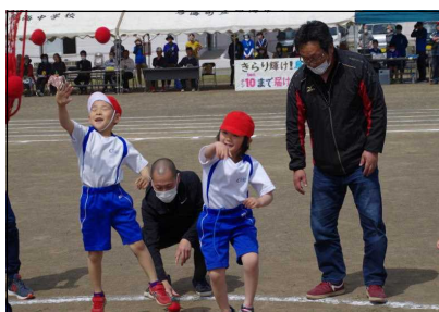
低学年親子で玉入れ合戦