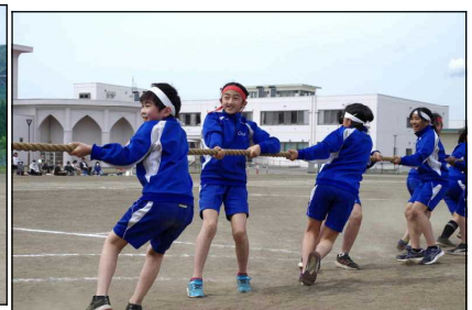
高学年 親子で綱引き