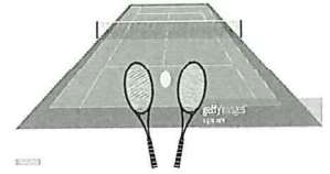
テニスコート前トイレ