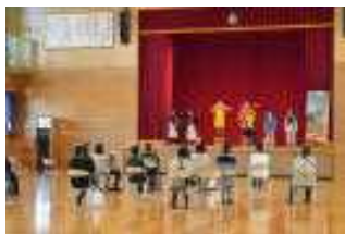
3年生の授業を参観

みんなの登校日に多くの保護者の皆様や地域の皆様にも足を運んでいただきました。PTAとは少し違って、祖父母の皆様からも来ていただき感謝しております。