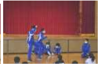
5年生 自然教室 火のおこし方