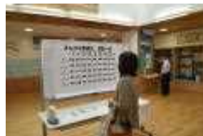
玄関ホールの様子